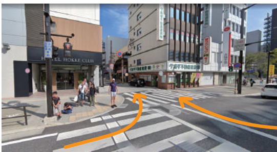
①法華クラブ様・クボタ不動産建設様の間の通りにお入りください。