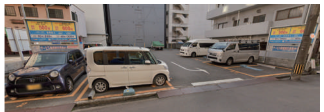
出し入れ不可 ④ パラカ大分市都町第一 19:00 ~ 翌 8:00 ¥1,000 上記以外 8:00 ~ 19:00 60 分 ¥200