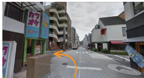
②カラオケの角を左折してください