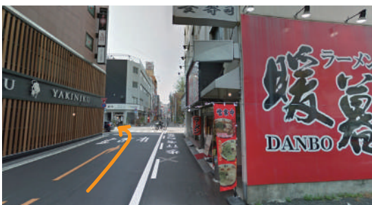
③赤い看板のラーメン屋を目印に左折してください。