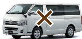
ワンボックスカー