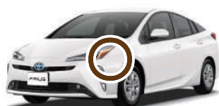
コンパクトセダン