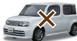
コンパクトカーや軽でも背が高いクルマ