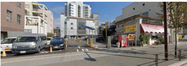
出し入れ不可 ① タイムス大分昭和通り 入庫後 24 時間 ¥880