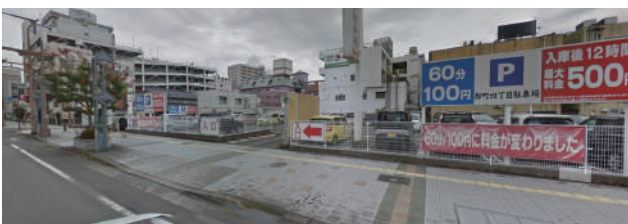
出し入れ不可 ③ 都町 4 丁目駐車場 入庫後 12 時間 ¥500 以降 60 分 ¥100