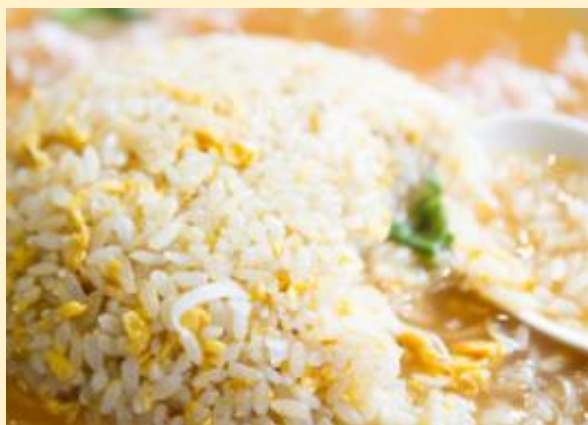
あんかけチャーハン