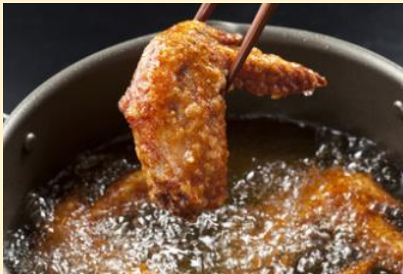
ガブリつき手羽先