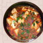
陳麻婆豆腐 (ご飯付き)