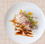
雲白肉 グレープフルーツと甜醤油