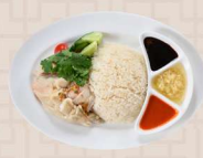
シンガポールチキンライス