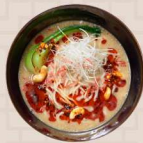
干しエビと胡麻の濃厚担々麺