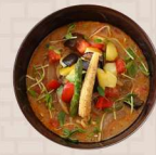
焼き野菜の柚子風味中国味噌蕎麦