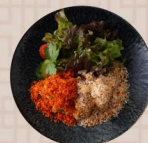
2種スパイスパン粉唐揚げ