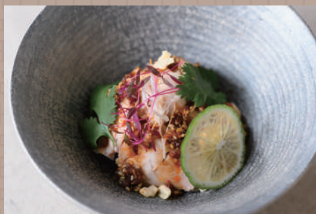
大分産ハーブ鶏の四川風よだれ鶏