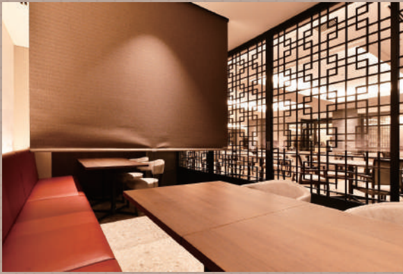
プライベート感あふれる個室