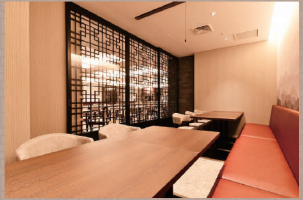
少団体も possible の個室。飛沫ガード設置も可。