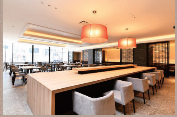
ペアでもご利用可能のカウンター席