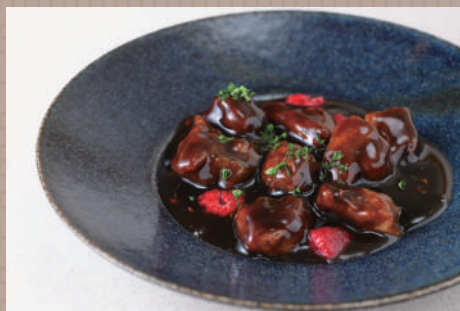
フランボワーズ風味の黒酢豚