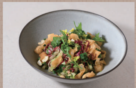
チャイニーズサラダ