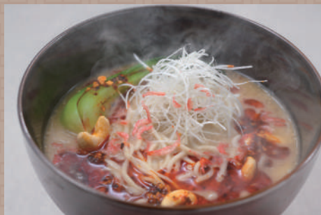
干しエビと胡麻の濃厚担々麺