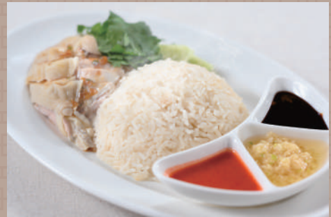
シンガポールチキンライス