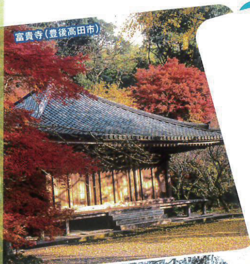
富貴寺(豊後高田市)

※補助金終了後、キャンペーン終了となります。 ※キャンペーン期間の詳細は特設サイトでご確認ください。