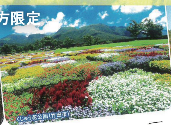
くじゅう花公園(竹田市)