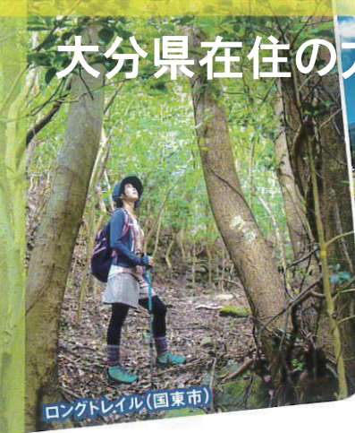
ロングトレイル(国東市)