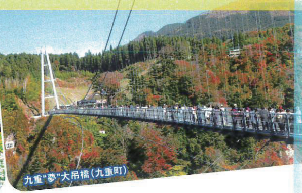
九重"夢"大吊橋(九重町)