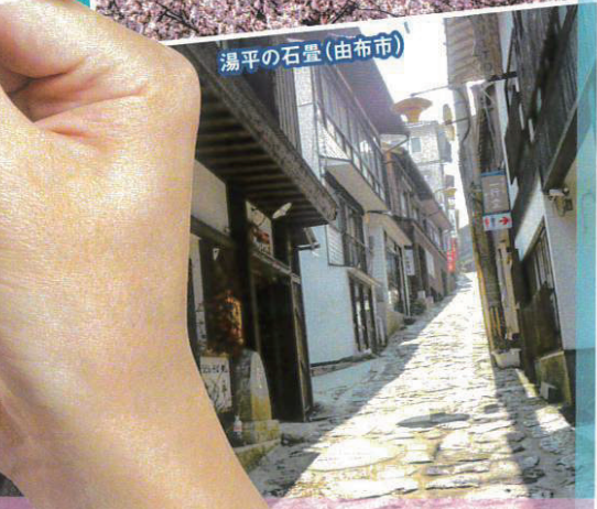
湯平の石畳(由布市)