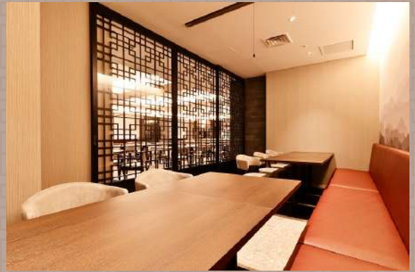
少団体も possible の個室。飛沫ガード設置も可。