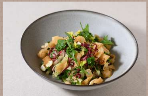
チャイニーズサラダ