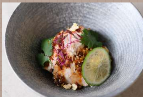
大分産ハーブ鶏の四川風よだれ鶏