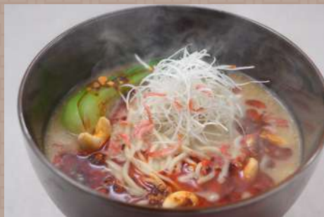
干しエビと胡麻の濃厚担々麺