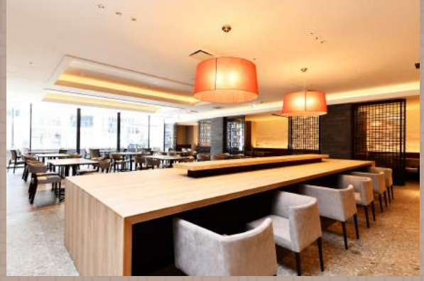
ペアでもご利用可能なカウンター席