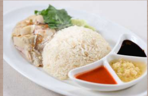
シンガポールチキンライス