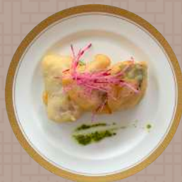
白身魚のフリット バジルソース