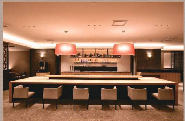
カウンター席 カップルでも楽しめるカウンタータイプ