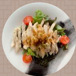
大分県産ハーブ鶏の香味ソース

「モダンチャイニーズ」という言葉は聞き慣れないのではないのでしょうか。 中華料理にフレンチテイストを加えた料理を「モダンチャイニーズ」として 我々はおお客様にご提供しております。 見た目も楽しめる新しい味わいの中華料理を楽しんで頂きたい。 そんな思いをもって日々料理をお作りしております。 様々なモダンチャイニーズをご堪能頂けるオーダーバイキングをお楽しみください。