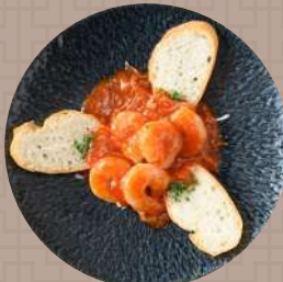
海老のチリソース