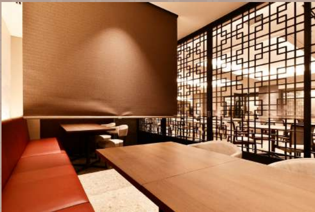
個室 ロールスクリーンで仕切られたプライベート空間が多数