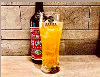
紹興酒 × ハイボール ドラゴンハイボール