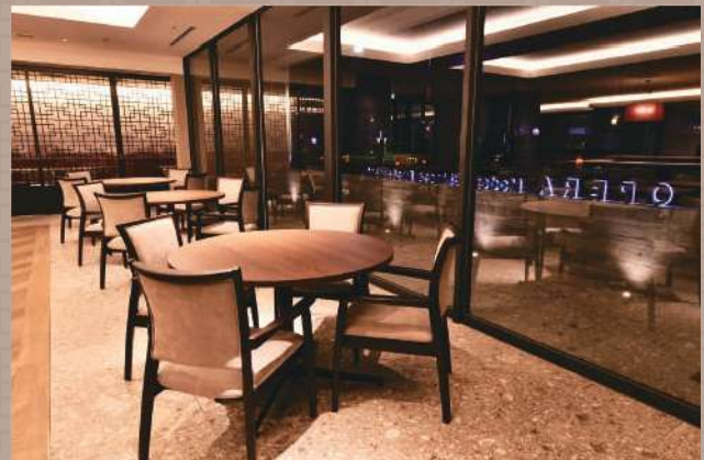
ストリートビュー席 外の景色を楽しめる開放的な席