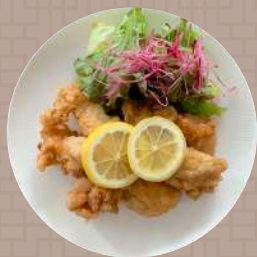
唐揚げのレモンソース