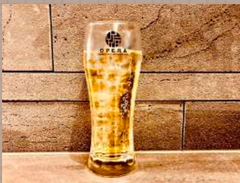
ピリッとスパイシー ペッパーハイボール