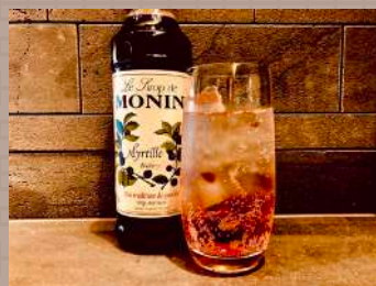
ノンアルコールカクテルも充実