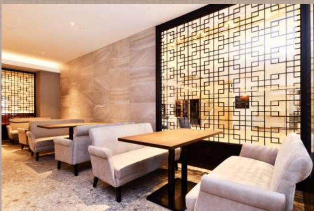
ソファ席 ゆったりと寛げる居心地に優れたお席