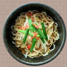
もやしとニラ入りラーメン