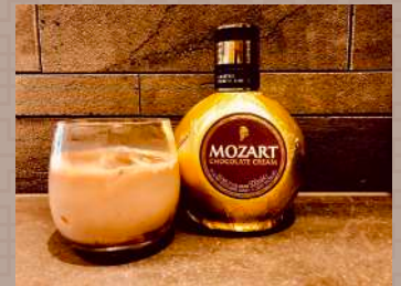
人気のチョコレートカクテル