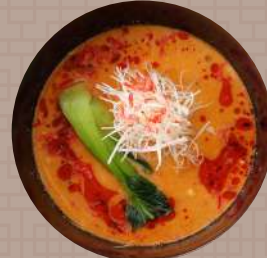
干し海老と胡麻の濃厚担々麺