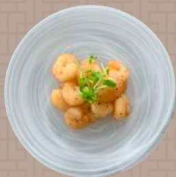
海老の塩ダレソース