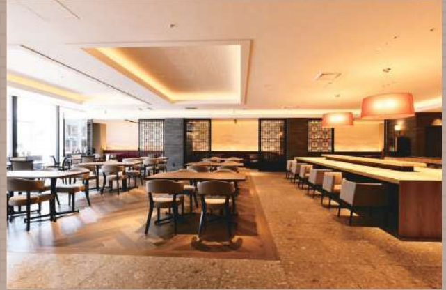
オープン席 ソーシャルディスタンスを意識した広々レイアウト