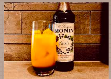
ノンアルコールカクテル カシスオレンジ