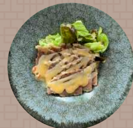
牛ホホ肉のボイル ハニーマスタード