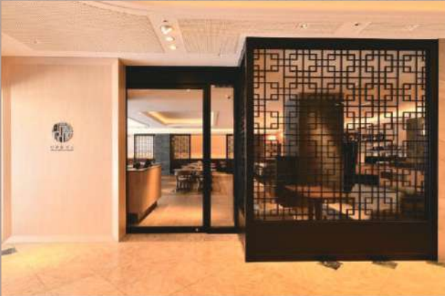
アートホテル大分1Fフロア 店頭