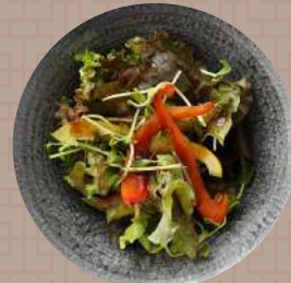
ミックスチャイニーズサラダ