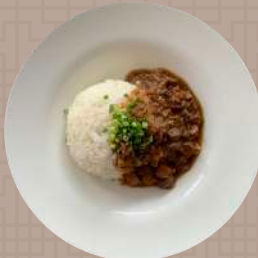
オペラルーロー飯