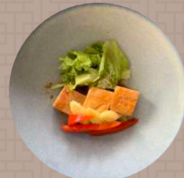
豚肉、ヤングコーン、パプリカ 中華風旨煮