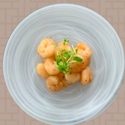
海老の塩ダレソース