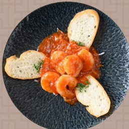
海老のチリソース