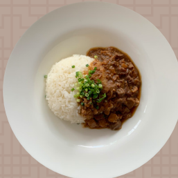
オペラルーロー飯