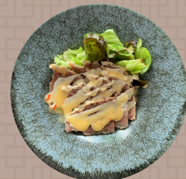
牛ホホ肉のボイル ハニーマスタード