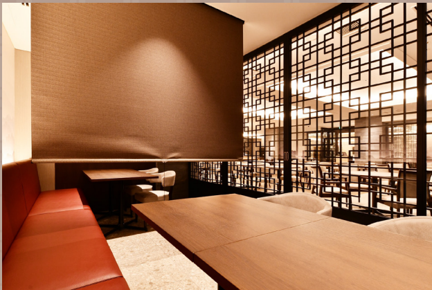
個室 ロールスクリーンで仕切られたプライベート空間が多数