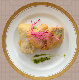
白身魚のフリット バジルソース