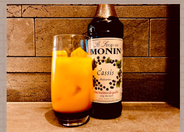
ノンアルコールカクテル カシスオレンジ