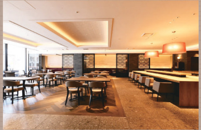
オープン席 ソーシャルディスタンスを意識した広々レイアウト