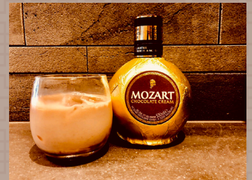
人気のチョコレートカクテル