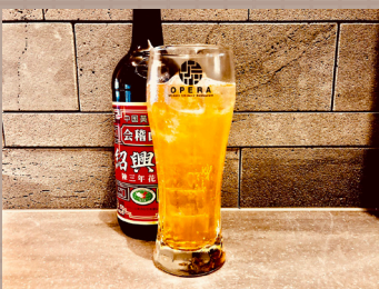
紹興酒 × ハイボール ドラゴンハイボール