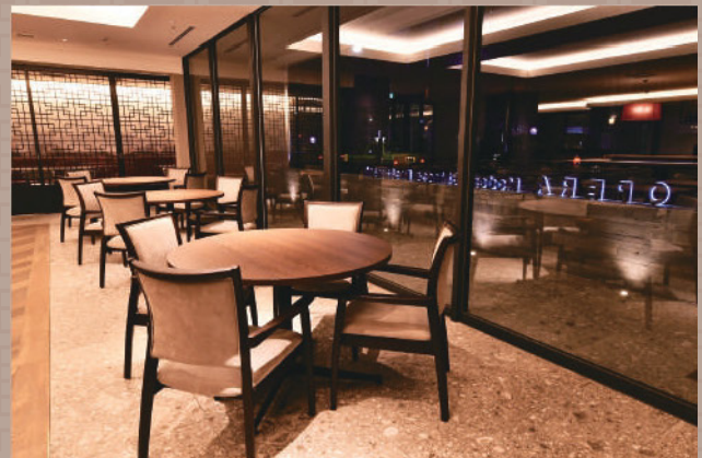
ストリートビュー席 外の景色を楽しめる開放的な席