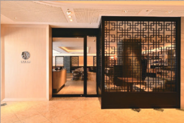
アートホテル大分1Fフロア 店頭