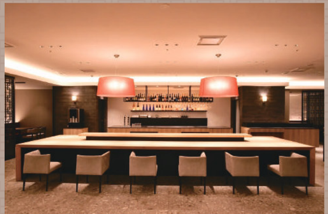
カウンター席 カップルでも楽しめるカウンタータイプ