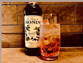
ノンアルコールカクテルも充実