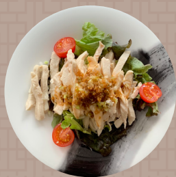
大分県産ハーブ鶏の香味ソース

「モダンチャイニーズ」という言葉は聞き慣れないのではないのでしょうか。 中華料理にフレンチテイストを加えた料理を「モダンチャイニーズ」として 我々はおお客様にご提供しております。 見た目も楽しめる新しい味わいの中華料理を楽しんで頂きたい。 そんな思いをもって日々料理をお作りしております。 様々なモダンチャイニーズをご堪能頂けるオーダーバイキングをお楽しみください。