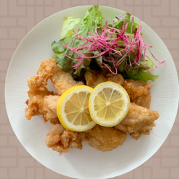
唐揚げのレモンソース