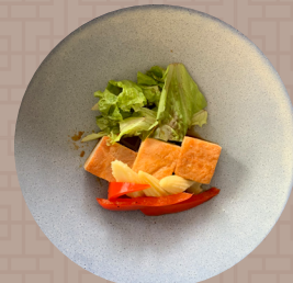
豚肉、ヤングコーン、パプリカ 中華風旨煮