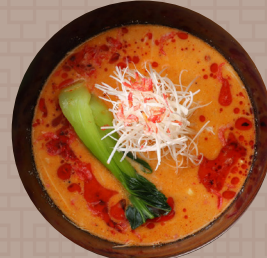
干し海老と胡麻の濃厚担々麺