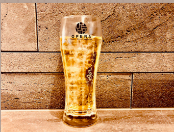
ピリッとスパイシー ペッパーハイボール