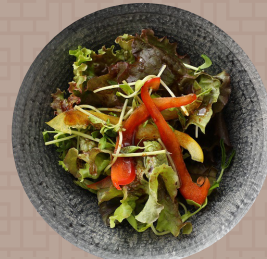
ミックスチャイニーズサラダ