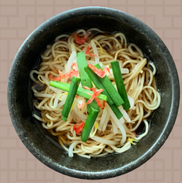
もやしとニラ入りラーメン