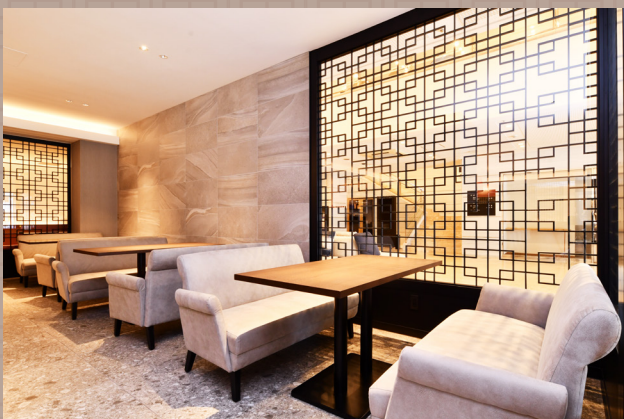
ソファ席 ゆったりと寛げる居心地に優れたお席