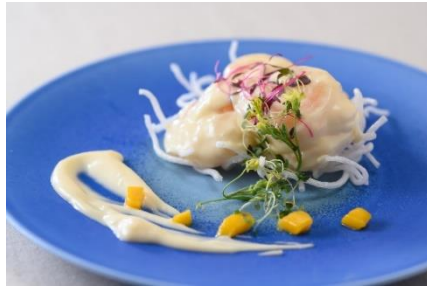
マンゴー風味のエビマヨ