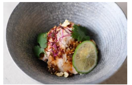
大分産ハーブ鶏の四川風よだれ鶏