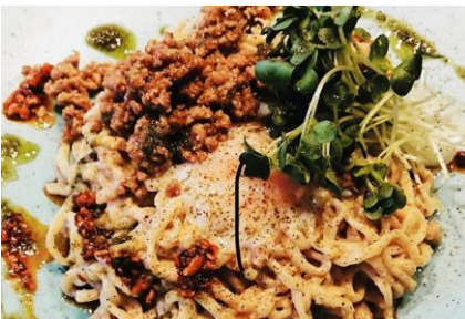
花椒薫る冷製担々麺