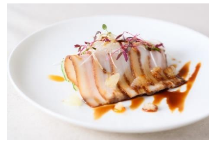
雲白肉 グレープフルーツと甜麵醬