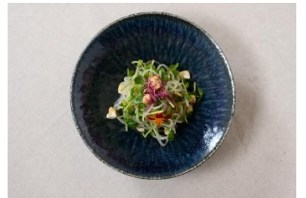
パクチーと豆苗、シェリー風味の 春雨サラダ