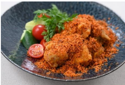
鶏もも肉のスパイシーパン粉