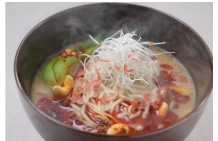
干し海老と胡麻の濃厚担々麺