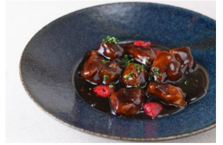
フランボワーズ風味の黒酢豚