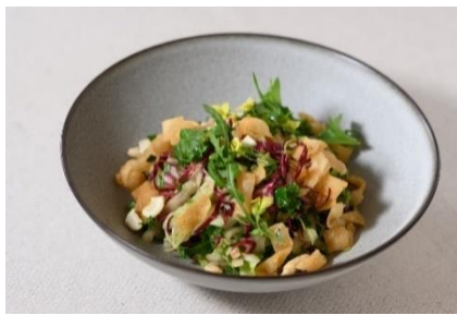
8種野菜のモダンチャイニーズサラダ